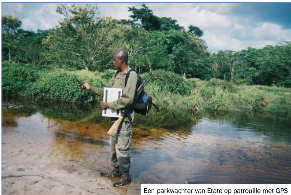
Een parkwachter van Etate op patrouille met GPS

en Januari vervoeg ik hen in Etate. We zullen dan eerst hun gegevens downloaden en een beschrijvende analyse van hun resultaten maken. Daarna beginnen we samen met het trainen van wachters uit naburige patrouilleposten – die zullen met ons het woud intrekken, want dat is de enige manier om hen met hun patrouillegebied vertrouwd te maken. Tegelijk brengen we natuurlijk de fauna en vegetatie in kaart – voor ons een uitstekende gelegenheid om na te gaan hoe continu de bonobo populatie van Etate is, want tot dusver lijkt er nog geen einde aan te komen. Ook onze andere projecten rond Salonga lopen intussen op volle toeren. Het agricultuurproject in 9 dorpen, dat APAS mee op gang bracht, wordt nu voor ons van nabij opgevolgd door de lokale NGO CLEXAS. De productie van gewassen verloopt goed, en er zijn multiplicatievelden voor de zaden aangelegd. Ook het project volwassenenonderwijs kent een sterke groei; 180 dorpelingen volgen de lessen met veel enthousiasme. Binnen enkele weken nemen we een derde leraar in dienst. U merkt het: ondanks regelmatige tegenslagen gaat het al bij al zo slecht nog niet in 'de' Congo – maar er moet voor geknokt worden! Wil u meer weten of wil u dit project ondersteunen: http://www.zoosociety.org/Conservation/